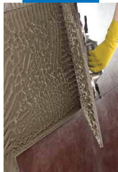
Необходимо смачивать 100% обратной стороны плитки при укладке крупноформатного гранита