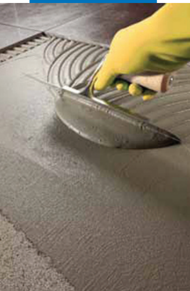
Укладка плитки на Kerabond T-R на пол